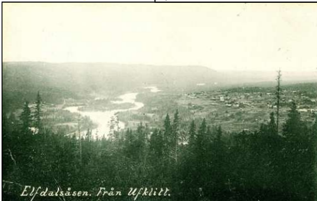
Elfdalsåsen. Från Ufklitt.

Jag och mina barn skulle besöka några vänner. På vägen stannade jag till för att ta ut lite pengar i bankomaten. Min femåriga dotter såg fascinerat på när hundralapparna matades ut. "Mamma", sa hon och svalde, "när du dör, kan jag få det där kortet då?"